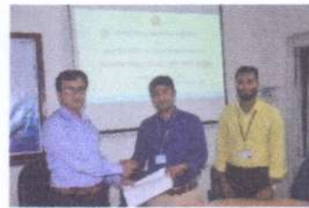
MoU স্বাক্ষরের স্থির চিত্র