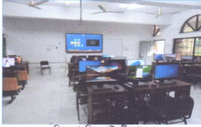
চিত্রঃ আধুনিক আইওটি ল্যাব