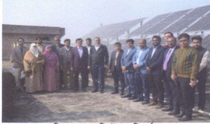
চিত্রঃ সোলার সিস্টেম পরিদর্শন

এসডিজির লক্ষ্য বাস্তবায়নের পথে রাজশাহী মহিলা পলিটেকনিক ইনস্টিটিউটে গ্রিন এনার্জি নিশ্চিতকরণের জন্য ১০ কিলোওয়াট ক্ষমতাসম্পন্ন সোলার সিস্টেম স্থাপন করা হয়েছে।